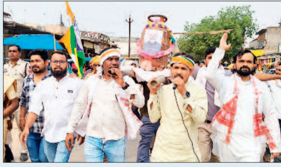
जमकर नाली में चाय बनाने का वीडियो वायरल हो रहा है, मैनपुर में कांग्रेस कार्यकर्ताओं ने सड़क