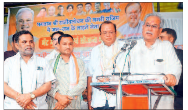
सत्ता से ज्यादा जनता का प्यार कीमती : भूपेश बघेल